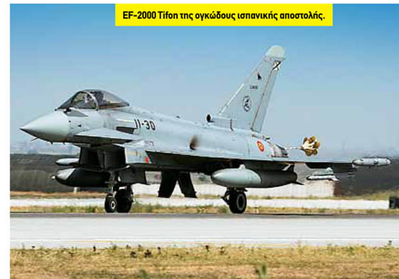
EF-2000 Tifon της ογκώδους ισπανικής αποστολής.

γίνει το 2013 στην έκθεση αμυντικού υλικού IDEF της Κωνσταντινούπολης (με επιμέρους απάρτια, εξωτερικά φερόμενο ατρακτίδιο και σύστημα συρόμενων / αναλίσσιμων «δολωμάτων»), αλλά και με την εκπεφρασμένη πρόθεση για προσθήκη προειδοποιητή επερχόμενου βλήματος. Το πρόβλημα φαίνεται να υπάρχει στα διθέσια, τα οποία μετά τον εκσυγχρονισμό απέκτησαν πλήρεις δυνατότητες «missionized» αεροσκαφών και, φυσικά, η ΤΗΚ θέλει να τις εκμεταλλευτεί προς την κατεύθυνση της νυκτερινής κρούσης βαθείας διείσδυσης. Δεδομένου ότι τα αεροπλάνα αυτά δεν έχουν τη ραχιαία προέκταση της απράκτου, η οποία προσφέρει τον αναγκαίο επιπλέον χώρο, υιοθετήθηκε η λύση της προσθήκης του απαραίτητου για την αποστολή παρεμβολέα σε εξωτερικό ατρακτίδιο (που, βέβαια, αφαιρεί τη δυνατότητα μεταφοράς φορτίου). Έτσι, για τα διθέσια Block 40/50 παραγγέλθηκαν 21 ατρακτίδια AIDEWS (Advanced Integrated Defensive Electronic Warfare Suite) ALQ-211 έναντι 75 εκατομμυρίων δολαρίων από την αμερικανική Exelis. Να υπενθυμίσουμε ότι τα τουρκικά Block 50+ Advanced φέρουν τον παρεμβολέα αυτόν εσωτερικά μέσω του συστήματος αυτοπροστασίας τους, αφού τα διθέσια της έκδοσης αυτής διαθέτουν τη ραχιαία προέκταση της απράκτου. ΠΒΘ