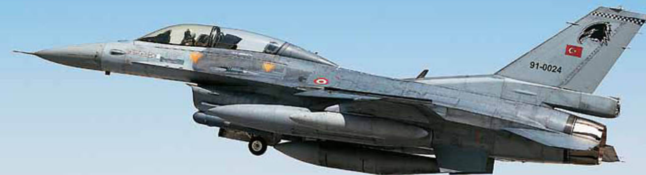
F-16D Block 40, τα οποία έχουν γίνει πλέον «missionized» μετά τον εκσυγχρονισμό τους.

danian Air Force ανέφεραν ότι η αεροπορία της μεσανατολικής χώρας βρίσκεται σε αναδιοργάνωση και «ορθολογική αναθεώρηση των οροφών», στο πλαίσιο της οποίας εντάσσεται και η πρόσφατη πώληση 13 Fighting Falcon στο Πακιστάν, με πιθανότητα περαιτέρω παραχωρήσεων. Σύμφωνα με τους Τούρκους, υπήρχαν άλλες δυο συμμετοχές που ακυρώθηκαν, η παλική για οικονομικούς λόγους, κάτι, όμως, που έγινε αρκετούς μήνες πριν, όταν η AMI περιέκοψε τις διεθνείς δραστηριότητές της στις αρχές του 2014, και αυτή της Βασιλικής Αεροπορίας του Ομάν, που, όπως και πέρυσι, φέρεται να ακύρωσε την τελευταία στιγμή. Τότε οι πληροφορίες έλεγαν ότι το Ομάν δεν είχε πάει στην ΑΕ 13-2 λόγω της αναταραχής που υπήρχε στην Τουρκία τη συγκεκριμένη περίοδο, ενώ φέτος ως αιτία αναφερόταν η αναταραχή... στην ευρύτερη περιοχή. Αναφορικά με τα E-3A, το NATO λόγω και της προσωρινής αναστολής λειτουργίας της έδρας των AWACS στη Γερμανία, η οποία ανάγκασε τη Συμμαχία να διασπείρει τα αεροπλάνα στις περιφερειακές βάσεις, είχε διαθέσιμα για την ΑΕ 14-2 τρία αεροσκάφη. Θα πρέπει να σημειωθεί ότι τα σενάρια της άσκησης προέβλεπαν τη χρήση τους μόνο από τις «κυανές» δυνάμεις, καθώς θεωρείται ότι οι τελευταίες δε θα επιχειρούν ποτέ χωρίς την υποστήριξη τέτοιων μέσων, ενώ για τις «ερυθρές» υπάρχει πάντα το αντίθετο ενδεχόμενο. Η ΑΕ 14-2, βέβαια, ήταν και η προεπιλεγμένη για τα Boeing 737 AEW&C του προγράμματος «Peace Eagle» της 131 Filo, τα οποία αξιοποιήθηκαν μόνο από την (τουρκική) «εχθρική» απεικόνιση.