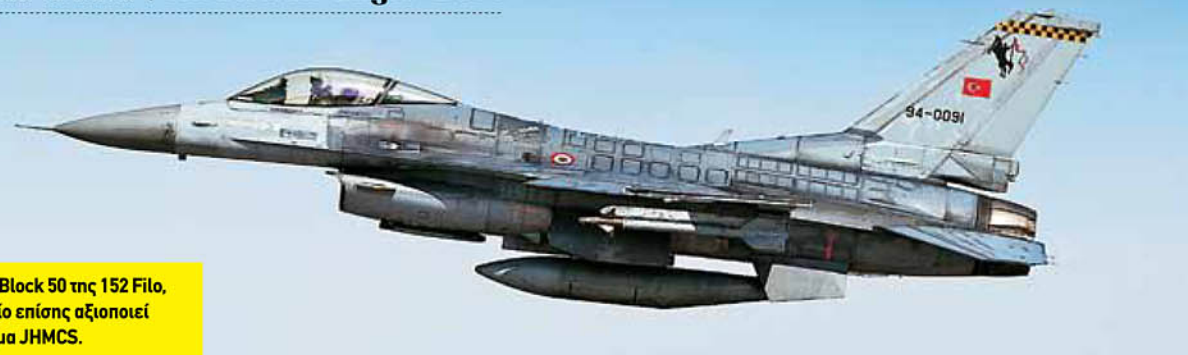
F-16C Block 50 της 152 Filo, το οποίο επίσης αξιοποιεί σύστημα JHMCS.

με δυνατότητα, μάλιστα, χρήσης πραγματικών πυρομαχικών (κάτι που δεν περιλαμβάνει η ΑΕ). Η άσκηση εξημερήθηκε επίσης από (μισθωμένη) υποδομή απεικόνισης GBAD, συμπεριλαμβανομένων και πυραυλικών συστημάτων SA-6, SA-8, SA-10, SA-11 και SA-15.