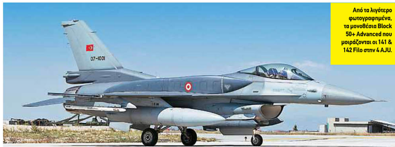
Από τα λιγότερο φωτογραφημένα, τα μονοθέσια Block 50+ Advanced που μοιράζονται οι 141 & 142 Filo στην 4 AJU.

Η Ιορδανία - με τακτική παρουσία στην Anatolian Eagle - έφερε φέτος μόνο τρία αεροπλάνα, δυο F-16BM και ένα F-16AM, ενώ τα στελέχη της Royal Jor-