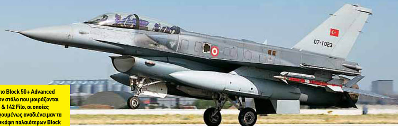
Διθέσιο Block 50+ Advanced από τον στόλο που μοιράζονται οι 141 & 142 Filo, οι οποίες προηγούμενα αναδιέμεναν τα αεροσκάφη παλαιότερων Block που διέθεταν.