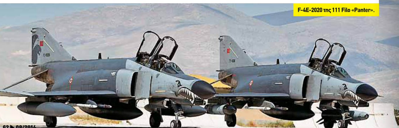
F-4E-2020 της 111 Filo «Panter».

Τον Μάρτιο του 2014 (που συμπίπτει με την έναρξη του οικονομικού έτους στις ΗΠΑ), η Lockheed Martin χρηματοδοτήθηκε με 698 εκατομμύρια δολάρια για απάρτια 57 αεροσκαφών της LRIP-9, η οποία συμπεριλαμβάνει έξι F-35A της Νορβηγίας, ένα F-35A και ένα F-35B για την Ιταλία, επτά F-35A για το Ισραήλ, δύο F-35A για την Ιαπωνία και έξι F-35B για το Ηνωμένο Βασίλειο. Τα συμβόλαια της LRIP-9 αναμένεται να υπογραφούν το 2015, αν, βέβαια, δεν υπάρξει καθυστέρηση με τη LRIP-8. Για να γίνει αντιληπτό το πόσο είναι καθυστερημένο το πρόγραμμα, θα πρέπει να αναφερθεί ότι το 2011 οι δυο LRIP (8 η και 9 η ) προβλέπονταν να έχουν 110 και 154 αεροπλάνα αντίστοιχα. Ακόμη, όμως, και το 2012, η εκτίμηση για τη LRIP-8 ήταν για 90 αεροσκάφη, για να καταλήξει τελικά στα 35. Είναι, μάλιστα, η ταχεία υλοποίηση της προμήθειας F-35 από την Ιαπωνία που ωθεί τα πράγματα, όπως θα γίνει στη