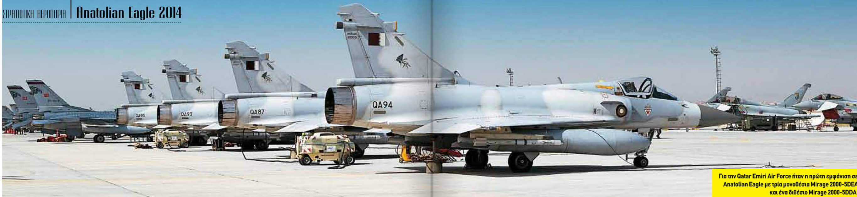
Για την Qatar Emiri Air Force ήταν η πρώτη εμφάνιση σε Anatolian Eagle με τρία μονοθέσια Mirage 2000-5DEA και ένα διθέσιο Mirage 2000-5DDA.

παράδοση του τρίτου αεροσκάφους στο τέλος του 2014 και του τέταρτου το πρώτο τρίμηνο (αρχές) του 2015, που θα προσφέρουν στην Τουρκική Αεροπορία την πλήρη δύναμη αεροσκαφών έγκαιρης προειδοποίησης και ελέγχου επιχειρήσεων στον εναέριο χώρο πάνω από χερσαίο και θαλάσσιο περιβάλλον.