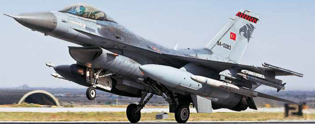
Εκσυγχρονισμένο F-16C Block 50 της 192 Filo. Διακρίνεται η κάσκα JHMCS που φορά ο χειριστής και, φυσικά, ο AIM-9X.