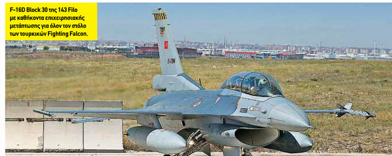
F-16D Block 30 της 143 Filo με καθήκοντα επιχειρησιακής μετάπτωσης για όλον τον στόλο των τουρκικών Fighting Falcon.