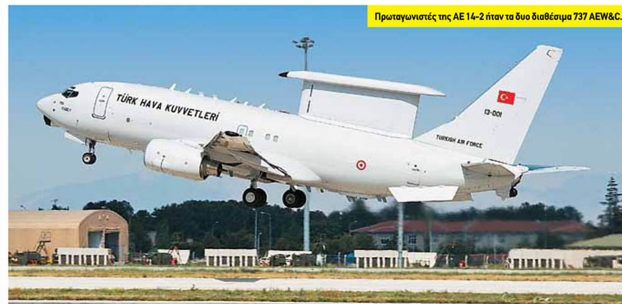
Πρωταγωνιστές της ΑΕ 14-2 ήταν τα δυο διαθέσιμα 737 AEW&C.

Η άλλη σημαντική εξέλιξη στην ΤΗΚ, η οποία ήταν, ιδιαίτερα εμφανής στην ΑΕ 14-2, ήταν η παρουσία των νεοπαρηληφθέντων 737 AEW&C, για τα προβλήματα, βέβαια, των οποίων - που φαίνεται να έχουν πλέον επιλυθεί - έχουμε κάνει επανειλημμένες αναφορές. Η Boeing παρέδωσε, τελικά, το πρώτο αεροπλάνο του προγράμματος «Peace Eagle» στις 31 Ιανουαρίου, ενώ το δεύτερο ακολούθησε στις 2 Μαΐου. Είχε προηγηθεί τον Απρίλιο η επίσημη έναρξη του τύπου στην 131 Filo στο Ικόνιο, ενώ, σύμφωνα με το δημοσιοποιημένο χρονοδιάγραμμα, εξακολουθεί να ισχύει η πρόβλεψη για